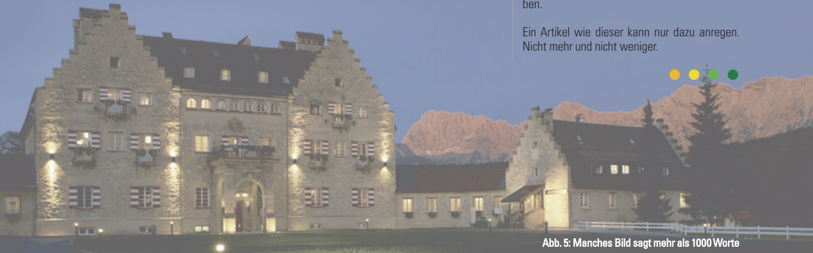
Abb. 5: Manches Bild sagt mehr als 1000 Worte

Ein Artikel wie dieser kann nur dazu anregen. Nicht mehr und nicht weniger.