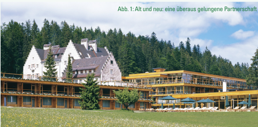
Abb. 1: Alt und neu: eine überaus gelungene Partnerschaft

Mit dem dieser Liaison der besonderen Art prompt folgenden Kaufvertrag kaufte er sich aber