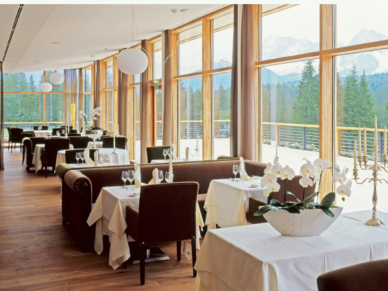
Abb. 2: Panorama mit 180 °: Das Restaurant

ungeahnte Schwierigkeiten ein. Sollte doch neben der stilgerechten Restaurierung des Mary Portmann-Schlusses ein kontrastierender moderner Zweckbau samt eines großzügiges Wellnesszentrums angegliedert werden. Anstelle der Bauarbeiter gaben sich aber von nun an Natur- und Denkmalschutz abwechselnd die Türklinke in die Hand, sodass „Das Kranzbach“ erst 2007 eröffnet werden konnte.