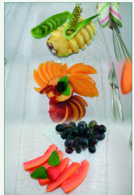
Abb. 5: Morgens werden neben der obligatorischen MorgenStund und der WurzelKraft auch Obst-Variationen für Gaumen und Augen serviert

Egal, ob das Frühstück mit dem Hirse-Buchweizen-Brei „MorgenStund“ oder mit Früchten, der opulente Salat mittags und vielfältige Kartoffelgerichte am Abend serviert werden, das omnimolekulare Lebensmittel „WurzelKraft“ ist immer dabei und spielt in der Regenata eine entscheidende Rolle. Das basenbildende und mineralstoffreiche 100-Pflanzen-Lebensmittel auf rein pflanzlicher Basis und damit umfassend bioverfügbar, besteht unter anderem aus Blütenpollen, einer breiten Kräuter-, Gewürz- und Gemüse Mischung, Kürbiskernen, Apfelgranulat, süßen Mandeln, Amaranth etc. Es enthält die Vitamine A, die B-Vita-