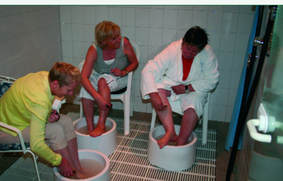
Abb. 3: Kommunikativ: Die basische Fußbaderunde

Und bieten mir das hervorragende Stichwort für das Kapitel, das den Reigen der ganz spezifischen und unvergleichbaren Leistungen des Kneipp- und Vitalhotels eröffnet: