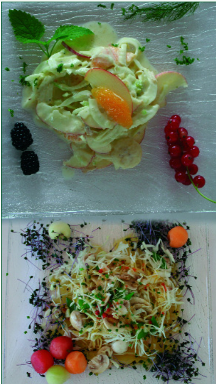
Abb. 6: Mittags: Salatvariationen...

mine, S, D, E, und K, Spurenelemente und bioaktive Substanzen sowie wichtige Mineral- und Vitalstoffe und bildet insofern im Konzert mit dem „7x7 KräuterTee“, einer Mischung aus 49 Kräutern, Samen, Gewürzen, Wurzeln und Blüten und der basischen Körperpflege „Meine-Base“ mit einem pH-Wert von 8,5 das unverzichtbare Gerüst der BasenKur des Peter Jentschura.