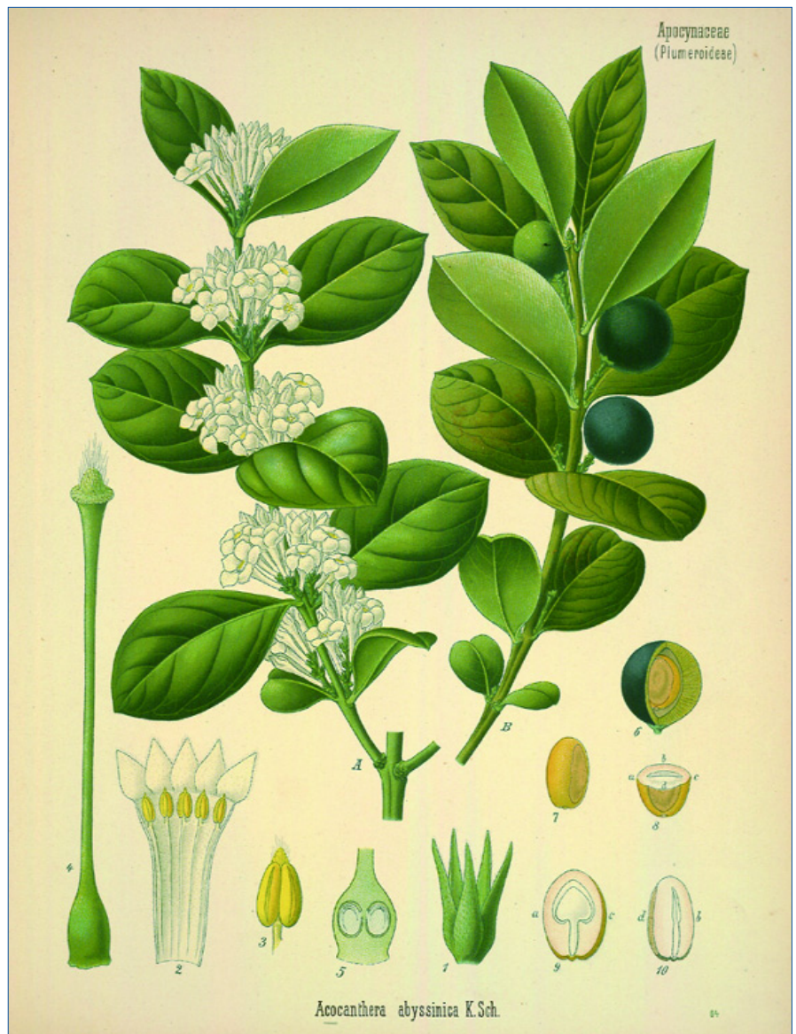
Abb. 2: Auch in der Pflanze Acocanthera ist das g-Strophanthin zu finden. Die ebenfalls gebräuchliche Bezeichnung OUABAIN leitet sich genauso von der Acocanthera-Pflanze ab, nämlich vom afrikanischen Ouabaio-Baum (Acocanthera ouabaio).

Prof. Manfred von Ardenne, einer der wohl genialsten Autodidakten unseres Jahrhunderts, überprüfte diese These durch Mikro-pH-Messungen am arbeitenden Herzen und fand, dass eine Anhäufung von Milchsäure und das Absinken des O 2 -Drucks unter 3,5 Torr in den unterversorgten Herzmuskelabschnitten den Atmungsstoffwechsel in Gärung umschlagen lassen. Dadurch nehme die Gärungs-Milchsäure noch mehr zu und führe an ungünstigen Stellen zu bis zu 1.000 kleinherdigen Nekrosen. Insbesondere im linken Ventrikel, der sich