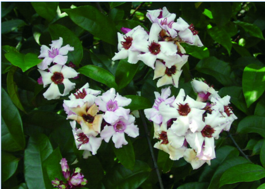
Abb. 1: Strophanthus gratus . Aus dieser Pflanze wird das herzwirksame Herzglykosid g-Strophanthin gewonnen.

Obwohl der Hauptwirkstoff des Samens des Schlingstrauchs Strophanthus fast ein Jahrhundert lang als das Mittel der Wahl bei Herzproblemen und zur Verhinderung des so genannten Herzinfarkts von der evidenzbasierten Schulmedizin geschätzt und flächendeckend eingesetzt wurde, fristet diese nach wie vor lebensrettende pflanzliche Substanz aus nur schwer nachvollziehbaren Gründen mittlerweile ein Nischendasein. Obwohl es mittlerweile sogar als körpereigenes Hormon entdeckt wurde. Dieser Artikel will über die Hintergründe, aber auch über die unverändert lebenserhaltende Relevanz des Strophanthins aufklären, insbesondere aber Mut machen, diese nach wie vor vorhandene Nische im Sinne der Erhaltung der eigenen Unversehrtheit und der Gesundheit Dritter couragiert zu nutzen und darüber hinaus zu erweitern.