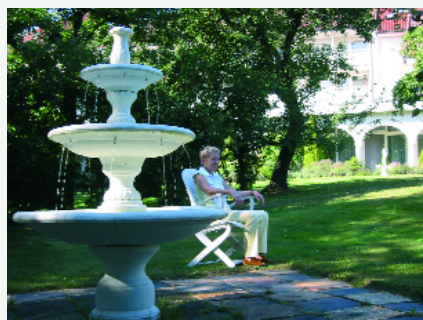
Abb. 2: Typisches Ambiente: Der Park

zu sein, sich wohl fühlen zu dürfen. Nichts soll an eine Klinik, nichts soll ständig an die eigene Krankheit erinnern. Deshalb wird auch mit kleinen dezenten Schildchen auf den Restaurant-Tischen empfohlen, sich beim Essen mal nicht an Krankheiten zu delectieren, sondern sich über die schönen Dinge des Lebens zu erfreuen. Deshalb wird auch angeregt, sich einmal einen ganzen Tag überhaupt nicht mit der eigenen Krankheit zu beschäftigen. Folglich wird im Haus der Gesundheit auch Wert auf ein gepflegtes Äußeres gelegt, folglich ist z. B. der Trainingsanzug beim Dinieren bei Kerzenschein absolut obsolet.