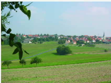
Abb. 1: Michelrieth, ländliche Idylle

Nun wollen wir uns endlich gemeinsam auf die Erkundungstour durch diese Oase der Ruhe und Entspannung, der ganzheitlichen Zuwendung, machen.