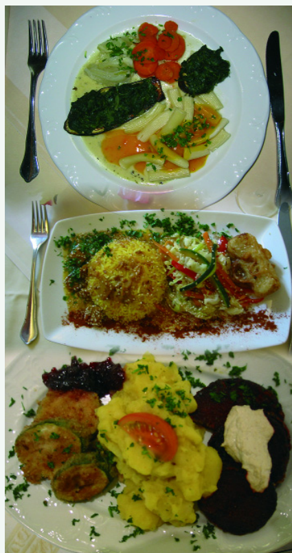
Abb. 5: Vegetarische Ernährung

und nimmt die Ernährung und die Lehre darüber sehr konsequent in das ganzheitliche Konzept auf. Natürlich werden Schulungen angeboten zu einer gesunden Lebensführung und Ernährungsweise. Die Naturklinik in Michelrieth hat diesen roten Faden aber konsequent