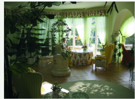
Abb. 3: Typisches Ambiente: Wintergarten

Mittlerweile haben die Phönix-Handwerker dem noch eine Krone aufgesetzt: Sie haben ihr ganzes Know-how und ihren großen Qualitätsehrgeiz hineingelegt, um im Dachgeschoss zu demonstrieren, wie aus ganz normalen zweckmäßigen Zimmern Räume zum Träumen, zum Genießen, zum Eintauchen in eine Märchenwelt werden können. Ob es das