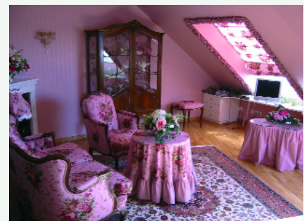
Abb. 4: La vie en Rose

kleine Appartement „La vie en Rose“ für eine Person oder das große Appartement mit Sonnenterrasse, einem Kamin, dem Lavendel-Schlafzimmer und mit traumhaften Bad ist, Gäste bzw. deren Besucher oder Angehörige können diese Traumwelten mieten. Da die Klinik mittlerweile Besucher aus der ganzen Welt hat und solche aus den arabischen Emiraten das Ärzteteam in Michelrieth sogar als deren „Hausarzt“ erkoren haben, werden diese kleinen Paradiese wohl selten leer stehen.