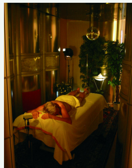
Abb. 8: Heilbehandlung im Energie-Spektralraum

Ich wähle lieber – ich denke und hoffe, ganz in Ihrem Sinn – einige beispielhafte Anwendungen aus, die Ihre Vorstellung über das Haus der Gesundheit viel mehr mit Leben erfüllen als protokollarische Vollständigkeitsansprüche.