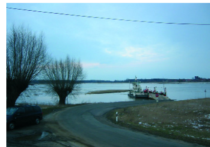
Abb. 14: typisch Altmark: Fähren statt Brücken

Ich habe zum Beginn dieses Artikels bereits einiges über die besondere touristische Qualität der Altmark berichtet. Wenn sich der Gast auch nur ungnen von dem Wohlfühl-Gutshof entfernen wird, von den sehr gemütlichen Zimmern, der altmärkischen Kräuterküche, die in der Guten Stube, dem Kontor und der Tenne stilvoll und in der gewohnten betont liebenswürdigen Servicequalität serviert wird, vom Digestif am offenen Kamin, natürlich auch von den beschriebenen vielfältigen Anwendungen, so lohnt sich dennoch eine mutige Entscheidung zur Verlängerung des Aufenthalts zwecks Erkundung des Umfeldes. Die sehr moderaten Preise des LandHotels AlbrechtsHof lassen eine solche Entscheidung ja auch viel leichter fallen.