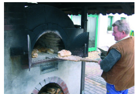
Abb. 6: selbstgebackenes Brot: ein großer Genuss

Nachdem wir das 6x8 m große Schwimmbecken durchschwommen, die Sauna und das römische Dampfbad besucht, den heißen Stein im Hammam bewundert haben, passieren wir auf dem Weg zur Kosmetikabteilung den im Freien stehenden Backofen, in dem das köstliche Brot des AlbrechtsHof – auch beliebtes Urlaubs-Mitbringsel – gebacken wird. Keine Sorge: