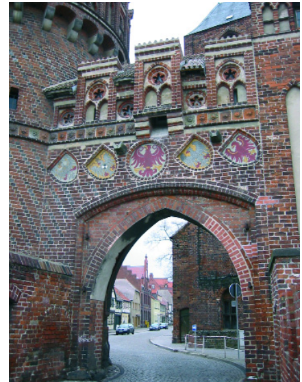
Abb. 16: typisch Altmark: Tangermünde