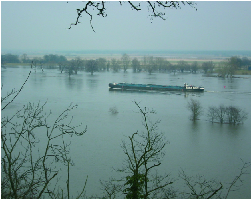
Abb. 15: typisch Altmark: Die Elb-Auen

Sie unbedingt die „magischen sieben“ ehemaligen Hansestädte im Herzen der Altmark, die – mittlerweile enddrucksvoll restauriert – mit ihrer Backstein-Romanik und -Gotik in längst vergangene Zeiten zurückversetzen. Da ist als allererstes Tangermünde zu nennen, ganz in der Nähe lohnt sich die Besichtigung des Klosters Jerichow, Salzwedel mit dem berühmten echten Salzwedeler Baumkuchen oder Havelberg an der Havel-Mündung, Stendal, Osterburg unweit des Hofguts in Düsedau, die Reihe der Sehenswürdigkeiten könnte beliebig fortgesetzt werden. Dazu gehört auch Arneburg mit Europas größtem, streng nach ökologisch orientierten Gesichtspunkten gebautem Zellstoffwerk als einer der großen Arbeitgeber der Region, gleich gegenüber auf der anderen Straßenseite die bedrückende Ruine des als leistungsstärkstes Atomkraftwerk der ehemaligen DDR geplanten Mammutprojekts, das zum Glück von der Wende gestoppt wurde. Der Schlossberg in Arneburg bietet in der ansonsten flachen Region den schönsten Blick über die weiten der Elbauen.