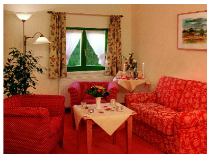
Abb. 2: Wohlfühl-Ambiente und ...