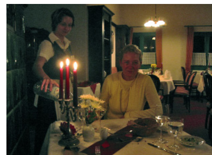
Abb. 3: ... freundlich zugewandter Service