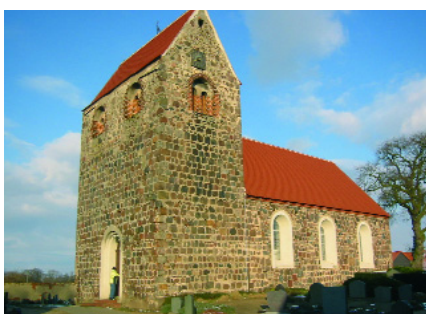
Abb. 1: typisch Altmark: Die Kirche in Düsedau

Dieses traumhafte Szenario für Natur- und Kulturliebhaber, Radfahrer, Reiter und Wanderer, nicht zuletzt für Kinder, bietet das beeindruckende und in sich harmonisch geschlossene Szenario für das LandHotel AlbrechtsHof. Nicht verschwenderischer Luxus und oft blendende Repräsentation stehen hier im Vordergrund, sondern anheimelnde Gemütlichkeit, die den Rahmen bildet für eine im guten Sinne des Begriffs ganzheitliche Ausrichtung auf Körper, Geist und Seele.