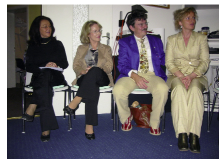
Das (ebenfalls) sehr zufriedene Ausbilder(innen)quartett

Die Vision für die baldige Zukunft, die alle diese Visionäre für eine menschenfreundliche Gesundheitsreformation hegen, ist eine Medizin, die naturgesetzlich arbeitet und denkt, ist ein Sozialsystem, welches Vorbeugung und