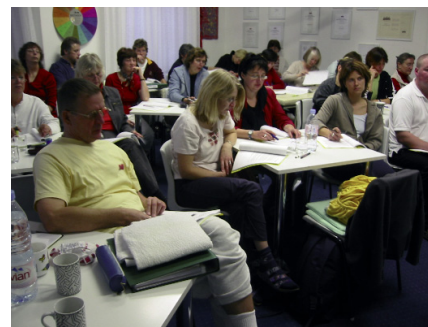
Rauchende Köpfe: Die Lerngruppe

Es gibt sie seit 26 Jahren, die Würzburger Berufsfachschule. In dieser Zeit hat sie sich einen Namen gemacht, und zwar über alle Grenzen hinweg. Neben den Schülern und