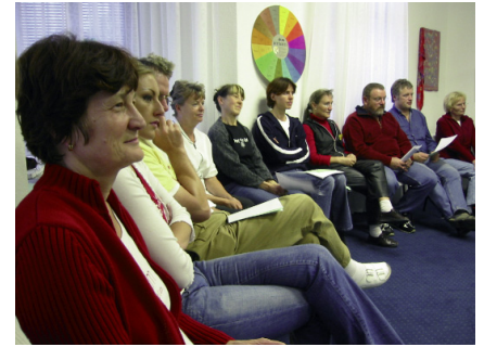
Zertifikat erhalten – alles ist gut!

Für mich persönlich war diese Erfahrung im Kreis der angehenden Gesundheitsberater im Fortbildungszentrum der Berufsfachschule in Würzburg unendlich wichtig. Ich habe nicht nur mit den anderen Kursteilnehmern gemeinsam gelernt, sondern wir haben aneinander gearbeitet, das Gelernte