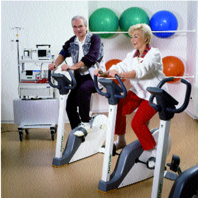
Check-Up am Ergometer

Die durch die Schließung der Spielbank notwendig werdende Neuausrichtung eröffnete Baden-Baden die zweite große Chance: Die Kur in Baden-Baden war plötzlich genauso schick wie vorher die Roulette-Kugel, das Friedrichsbad erregte plötzlich viel mehr Aufsehen als vorher mondäne Kurzweil. Natürlich war es folgerichtig, dass die sich nun entwickelnde Sanatorien-Welt den reichen Kurgast als Zielobjekt hatte, dass stilvolles Ambiente weiterhin die Planungen beherrschte.