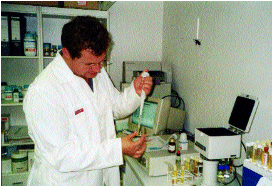
Die Messung der Freien Radikalen in den Blutproben

Vieles ist eigener Innovation entsprungen. So die