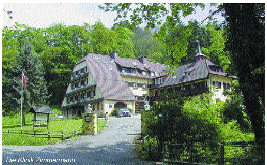
Die Klinik Zimmermann

Bekanntlich basieren die Artikel in der Serie „Klinik-Konzepte“ auf dem Stilmittel