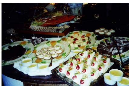
...in Hülle und Fülle

Mussten wir Posthotel-Gäste uns im Rahmen der klassischen Halbpension vor einigen Jahren noch bis zum abendlichen Gala-Diner irgendwie „durchschlagen“, so beinhaltet im Sinne der Reiterschen ständigen Erhöhung der Produktwertigkeit die selbe „Halbpension“ mittlerweile fast im Anschluss an das Frühstücks-Büfett ein fei-