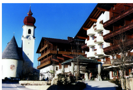
Idyllisch gelegen in der Dorfmitte

292 Betten in 154 Zimmern bilden auf einem Gelände von 36000 Quadratmetern