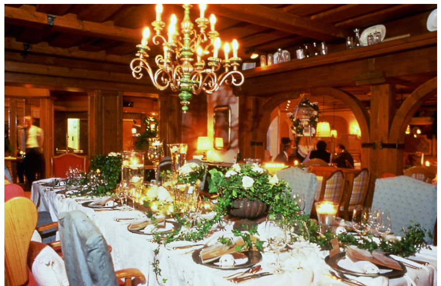
Eines der Restaurants