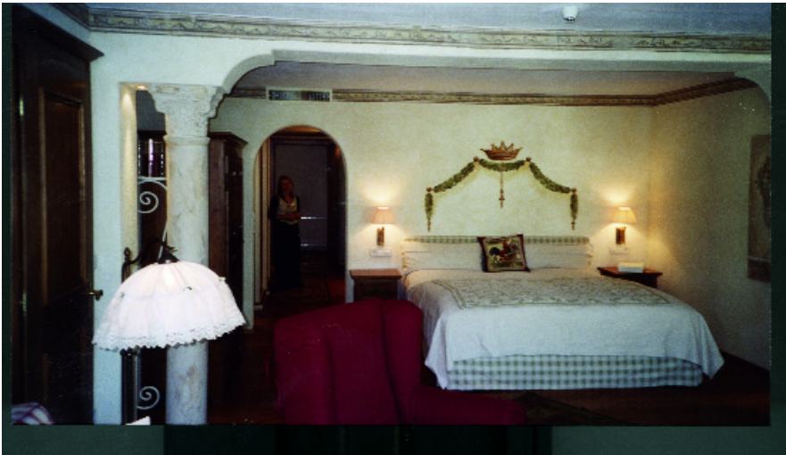
Die neuen Komfort-Zimmer im Landhaus West